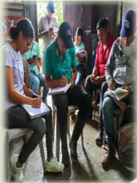
FORMACIÓN DE PROMOTORES