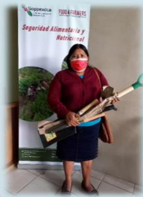
PROGRAMA DE REFORESTACIÓN