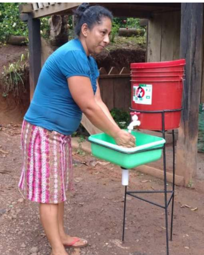
Instalación de lavamanos artesanales

Para aportar a la seguridad alimentaria y nutricional de los equinos, se estableció media manzana de pasto Angleton y media manzana de pasto Mombaza, que con un manejo adecuado (división y la rotación de pastoreo) promoverá el respeto por la naturaleza y garantizará que los animales estén más saludables. El cultivo de algunas especies de cítricos limitando el área de pasto y de patio, brindará a las familias a mediano plazo un banco de vitamina C, creará un microclima para la familia y brindará un refugio natural a los equinos.