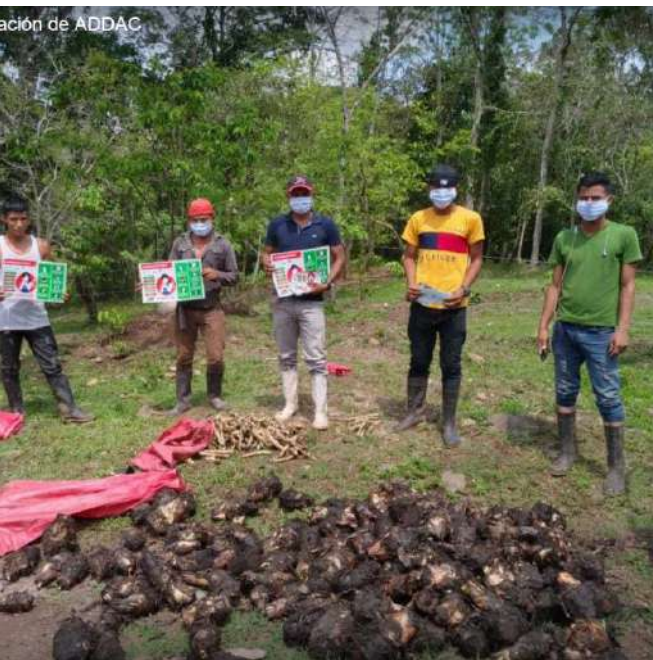
Instalación de ADDAC